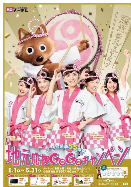
メ〜テレ開局55周年 「地元応援 GoGo キャンペーン」ポスター