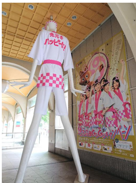
ハッピー姿も凛々しいけなちゃんの横には巨大ポスターを掲示