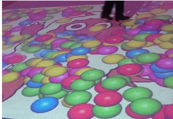
※写真は昨年の様子です。

12種類のコンテンツを用意し、イルミネーションと共に夜のリンクの楽しみを提供していきます。