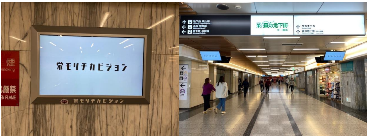
「森の地下街」に設置した「栄モリチカビジョン」

これらのメディアを通じて、地域の皆様に役立つ情報を発信するとともに人々のコミュニケーションを促進し、栄地区の新たな文化創造に寄与してまいります。