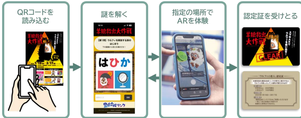
AR 謎解きの遊び方の流れ

自社のキャラクターを使ってスマホで楽しめるARを用いた謎解き企画を開発しました。メ〜テレキャラクター・ウルフイを捕らえた罠を解除することがミッション。謎を解くたびに、AR上で順に罠を外していき、救出成功で認定証をプレゼント。ユーザーのスマホだけで完結するコンテンツのため、イベント運営もスタッフも少なく、簡単に行えます。