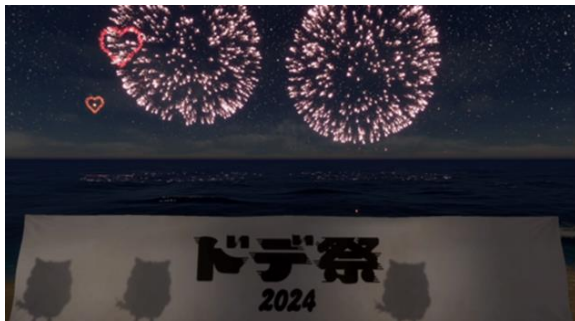
モニター前を歩くと花火が打ち上がります